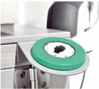
Sensortaster für Anlagenstart

Die gesamte Maschine kommt nahezu ohne Wartung aus. Wo regelmäßige Wartung anfällt, z.B. bei Austausch und Kontrolle der Filter der Laserstaubabsaugung, kann diese zur optimalen Zugänglichkeit auf Schienen aus der Maschine gezogen werden.