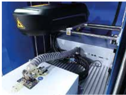
Wuchtkern für Umbau vorgezogen